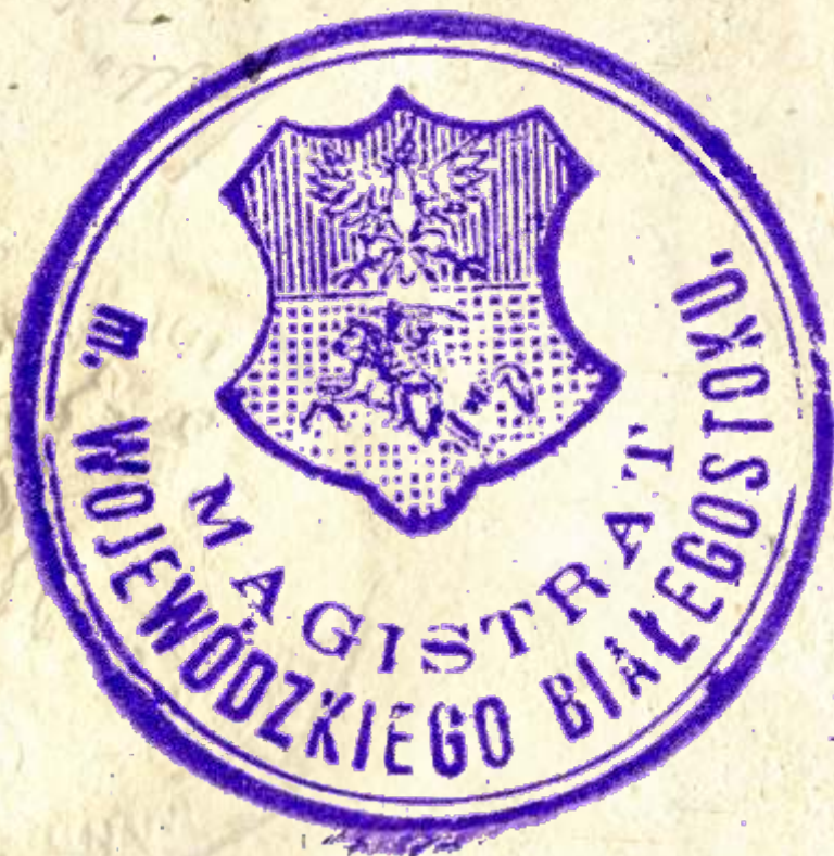
20. Magistrat miasta wojewódzkiego w Białymstoku, 1924 r., AP w Białymstoku, Akta notariusza Urbanowicza Bolesława w Białymstoku, nr zesp. 298, sygn. 18

Po odzyskaniu niepodległości miasto nadal korzystało z dawnego herbu powiatowego. Jego wizerunek wykorzystywano w sytuacjach uroczystych, np. na dyplomie honorowego obywatela miasta. Jednak z czasem herb powiatowy porzucono na rzecz formalnie nigdy nie należnego herbu obwodu białostockiego. Herb ten zaczęto stosować na pieczęciach miejskich, różnych władz i stowarzyszeń, znalazł się na odznace 42 pułku piechoty stacjonującego w Białymstoku. Wykorzystany też został w ozdobnym tableau pierwszego samorządu miejskiego wybranego 7 września 1919 r.