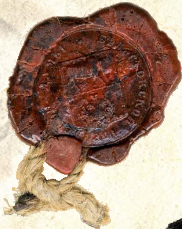
14. Pieczęć Białostockiej Gorodskoi Dumy (Rady Miasta Białegostoku), 1874 r., AP w Białymstoku, Akta stanu cywilnego Okręgu Bożniczego w Białymstoku, nr zesp. 264, sygn. 2