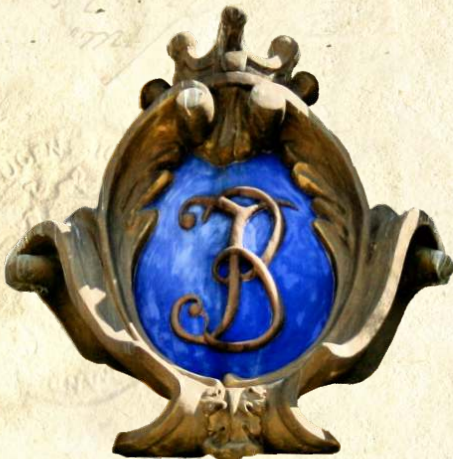
7. Ozdobny kartusz z inicjałami Izabeli Branickiej

Po śmierci Jana Klemensa Branickiego 9 października 1771 r. dożywotnią właścicielką miasta została jego żona Izabela z Poniatowskich. Pomimo trudności ekonomicznych wynikających z utraty sporej części dochodów męża Izabela dbała o pałac, miasto i jego mieszkańców. Prowadziła szeroką działalność kulturalną i oświatową, m.in. opiekowała się powstałą w 1777 r. w Białymstoku Szkołą Podwydziałową Komisji Edukacji Narodowej, szkołą parafialną, szkołę paziów. Podjęła też działania ograniczające samorząd miejski i wzmacniając pozycję własnego gubernatora. Kontrolował on nie tylko samorząd ale i landwójta, miał prawo sądzenia i karania mieszczan, a jego głównym obowiązkiem było chronienie miasta przed niebezpieczeństwami z zewnątrz, sprawowanie nadzoru policyjnego, ingerowanie w razie pojawiających się konfliktów, zwłaszcza jeśli zagrożone były interesy dworu. Miasto czasy najświetniejszego rozkwitu miało już za sobą, a jego kryzys powiększyła jeszcze epidemia ospy oraz kilkakrotnie nawiedzające je pożary.