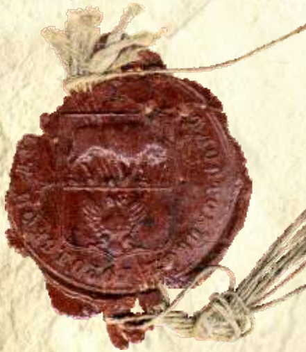
12. Pieczęć Rady Miasta Białegostoku, 1856 r., AP w Białymstoku, Akta stanu cywilnego Okręgu Bożniczego w Białymstoku, nr zesp. 264, sygn. 14