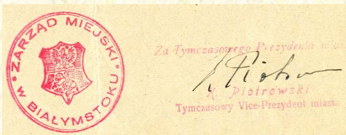
22. Błąd czy zmiana szrafowania? Pieczęć Zarządu Miejskiego w Białymstoku, luty 1934 r., AP w Białymstoku, Akta notariusza Urbanowicza Bolesława w Białymstoku, nr zesp. 298, sygn. 49