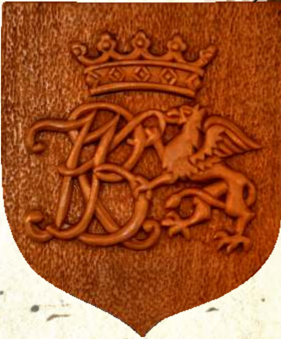
30. Herb umieszczony na fotelu papieskim wykorzystywanym w czasie wizyty Jana Pawła II w Białymstoku w dniu 5 VI 1991 r., fot. B. Samarski, 2012 r.

Co ciekawe dawny herb Białegostoku umieszczono na kartach wstępu do sektorów na lotnisku białostockiego aeroklubu w czasie pielgrzymki papieża Jana Pawła II do Białegostoku, która odbyła się 5 czerwca 1991 r. Umieszczono go także po lewej (dla patrzącego prawej) stronie oparcia fotela papieskiego, który stał przy ołtarzu w czasie mszy odprawianej przez Papieża na Krywlanach.