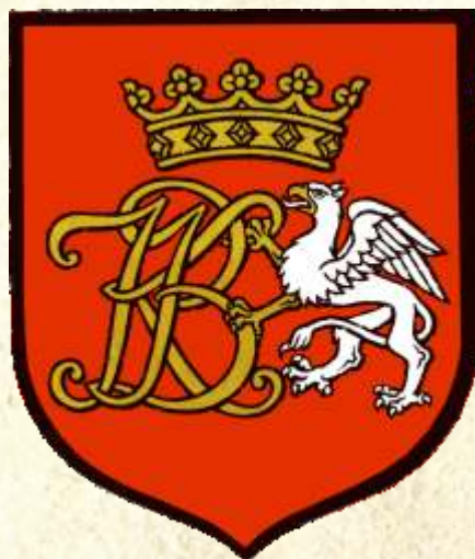
28. Herb Białegostoku w książce „Miasta polskie w tysiącleciu”, 1965 r., Miasta polskie w tysiącleciu, T. I, Wrocław-Warszawa-Kraków 1965

Brak uregulowanych spraw herbowych prowadził do pewnego chaosu informacyjnego. Zwraca uwagę ukoronowana część orła w górnym polu.