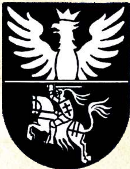
27. Herb Białegostoku w Wielkiej Encyklopedii Powszechnej PWN z 1962 r., Wielka Encyklopedia Powszechna PWN, Tom I, Warszawa 1962

Brak uregulowanych spraw herbowych prowadził do pewnego chaosu informacyjnego. Zwraca uwagę ukoronowana część orła w górnym polu.