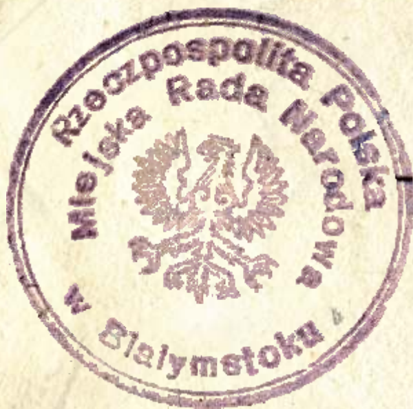
25. Pieczęć urzędowa Miejskiej Rady Narodowej w Białymstoku, 1944 r., AP w Białymstoku, Zarząd Miejski w Białymstoku, nr zesp. 88, sygn. 158