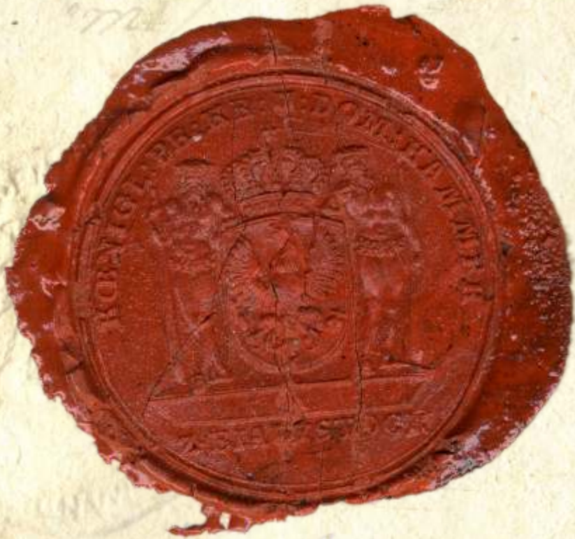
9. Pieczęć Kamery Wojny i Domen w Białymstoku, 1799 r., w otoku napis: Konigl. Pr. Kr. U Dom. Kammer z Bialystok, AP w Bialymstoku, Kamera Wojny i Domen w Bialymstoku, nr zesp. 2, sygn. 3104

Działalność władz pruskich doprowadziła do całkowitej przemiany miasta – z zaplecza istniejącego dworu Branickich w centrum administracyjne departamentu. W 1802 r. zapadła decyzja o zmianie właściciela miasta. Pałac i miasto Białystok wraz folwarkami Wysokistok, Białystok, z wsiami Białostoczek, Hussowicze (Ussowicze), Ogrodniki, Słoboda, Starosielce, Szelachowka (Szelachowskie) i Zawady i wszystkimi powinnościami poddanych, czynszami i daninami przeszedł na własność króla Prus. Departamentem Nowych Prus Wschodnich zarządzała Kamera Wojny i Domen Nowych Prus Wschodnich, której pieczęć przedstawiała orła pruskiego na tarczy zwieńczonej zamkniętą koroną królewską, po bokach tarczy dwie postacie trzymaczy stojących na postumencie. W otoku napis Koenigliche RR u Domen Kammer z Bialystok. Nie wiadomo czy władze pruskie zmieniły herb miejski Białegostoku. Być może korzystano nadal ze starego. Znany jest przykład Goniądza, w którym nadal używano starego herbu, z dodanym w otoku napisem Kon. Neu-Ost. Stadt Goniondz.