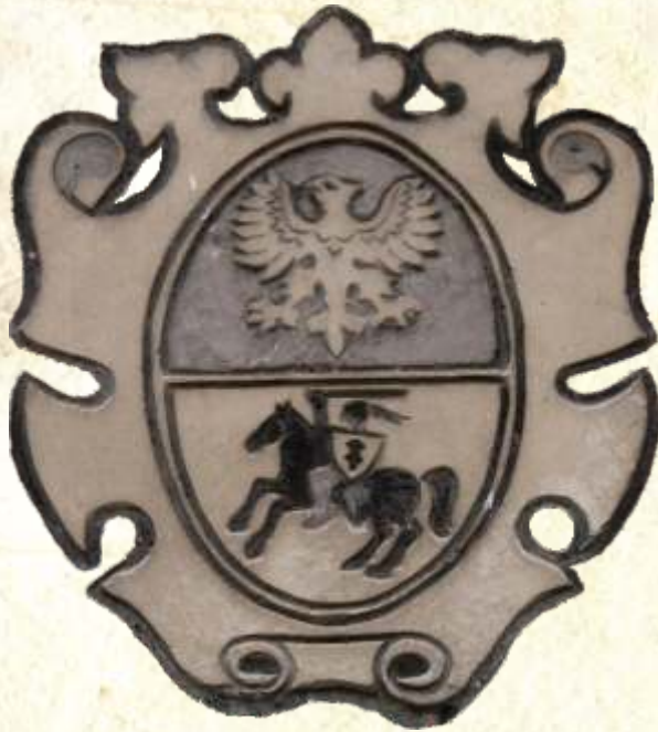
17. Stylizowany herb Białegostoku po 1966 r. podobny do herbu Księstwa Białostockiego, elewacja budynku przy Rynku Kościuszki 5A, fot. B. Samarski, 2012 r.

Herb przedstawiał się następująco: w górnym polu czerwonym orzeł srebrny, w dolnej części w złotym polu rycerz w niebieskiej zbroi z wzniesionym do ciosu mieczem i tarczą srebrną z krzyżem jagiellońskim, rycerz na koniu karym, czaprak czerwony z potrójną frędzlą złotą.