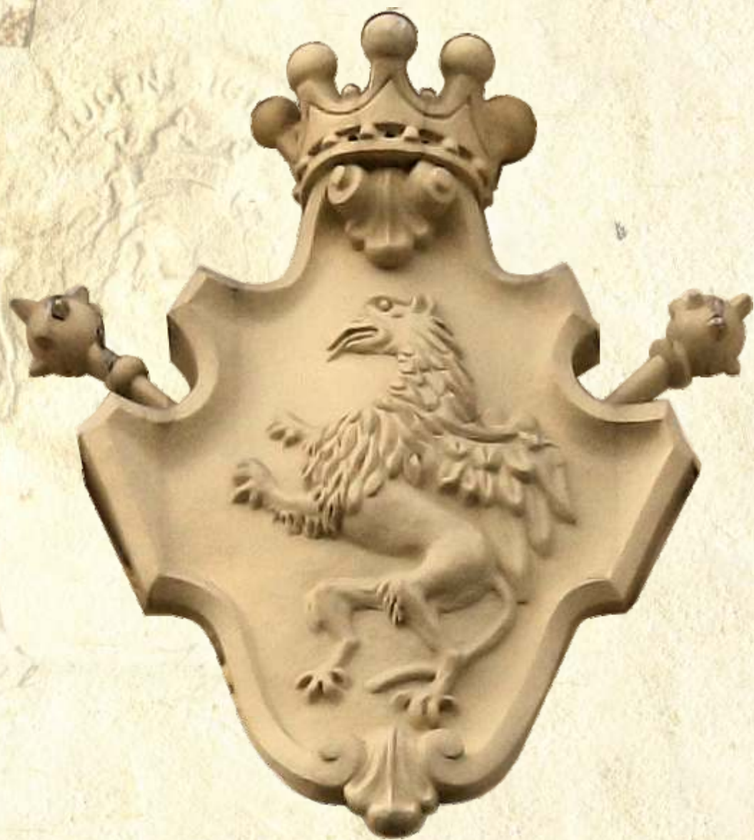
3. Gryf na elewacji Pałacu Branickich, fot. A. Gawroński, 2012 r.