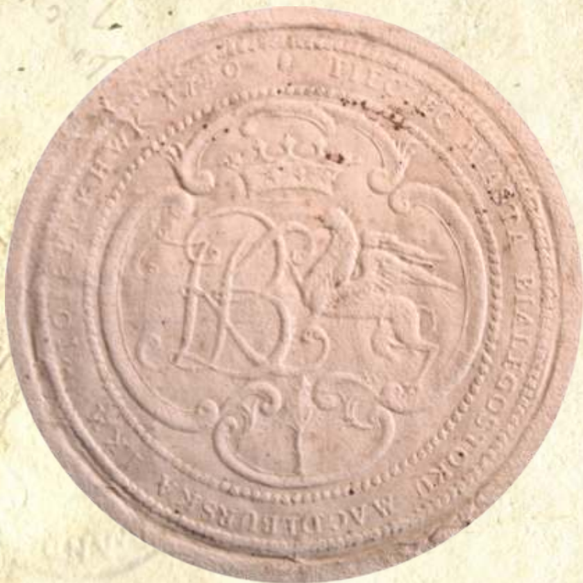
2. Pieczęć miasta Białegostoku magdeburska, 1759, Archiwum Główne Akt Dawnych, Archiwum Piłsudskich-Giniewtowiczów, nr zesp. 371, Zbiór pieczęci, sygn. B 20

Będący u szczytu kariery politycznej Jan Klemens wraz z małżonką Izabelą z Poniatowskich troszczyli się nie tylko o coraz wspanialszy pałac białostocki ale także o miasto. Hetman starał się pilnować wszelkich spraw miejskich, od handlu po sprawy administracyjne i porządkowe, rozplanowywał ulice, fundował budynki, sprawdzał stan zabudowań. Jeszcze przed otrzymaniem nowego przywileju na prawa magdeburskie Jan Klemens starał się polepszyć organizację miasta. W dniu 13 kwietnia 1745 r. wydał instruktarz regulujący prawa i obowiązki miasta, w którym szczegółowo omawiał regulamin wyboru burmistrza i całego urzędu miejskiego, zastrzegając, że elekcja ma się odbywać za jego wiedzą, zastrzega też sobie prawo usunięcia burmistrza przed upływem kadencji, gdyby ten odmówił posłuszeństwa. Ukoronowaniem starań Branickiego o podniesienie statusu Białegostoku było uzyskanie od króla Augusta III w dniu 1 lutym 1749 r. nowego przywileju nadającego prawa magdeburskie miastu. Nowy przywilej regulował prawo wyboru władz miejskich, określał organizację jurysdykcji oraz wyjaśniał sprawy podatkowe, nadawał miastu także nowy herb. Składał się na niego znak herbowy Branickich – Gryf z inicjałami Jana Klemensa Branickiego – JKB. Treść zaginionego oryginału dokumentu znamy z jego obaty w grodzie brańskim, gdzie jednak miejsce herbu zaznaczono