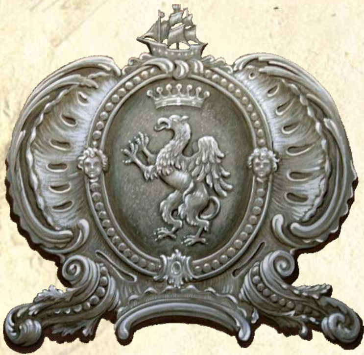
5. Gryf – nad wejściem do Aula Magna w Pałacu Branickich, fot. B. Samarski, 2012 r.

Gryf Branickich wymalowany obecnie ponad wejściem głównym do Auli Magna w Pałacu Branickich. Zwraca uwagę korona z siedmioma fleuronami. Tymczasem gryf Branickich nie był ukoronowany, a występująca w ich herbie korona opierająca się na tarczy posiada pięć fleuronów. Wykorzystywana w koronach herbowych ilość fleuronów była związana z rangą pieczętującego się rodu. Siedem fleuronów oznaczało, że pieczętująca się tym herbem osoba posiada godność hrabiego, natomiast pięć oznaczało godność księcia. Tego rodzaju herb spotykamy na pieczęci miejskiej z czasów zaboru pruskiego. W otoku znajduje się napis „Siegiel der stadt (....) Neu Ost. Preus”