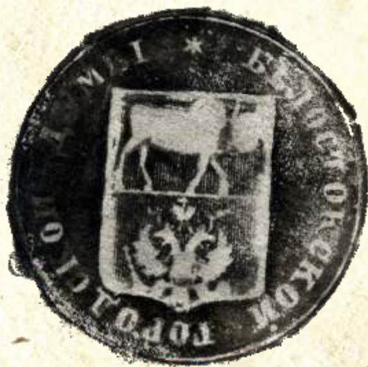
15. Pieczęć Białostockiej Gorodskoi Dumy (Rady Miasta Białegostoku), 1872 r., AP w Białymstoku, Akta stanu cywilnego Okręgu Bożniczego w Białymstoku, nr zesp. 264, sygn. 73

Zgodnie z rozporządzeniem Białystok musiał przyjąć herb powiatowy jako własny herb miejski. Herb oficjalnie stosowano z pewnymi wyjątkami aż do 1915 r. Jednym z takich wyjątków stanowiło pojawienie się po powstaniu styczniowym herbu miejskiego w wersji z dwugłowym orłem rosyjskim w dolnym polu.