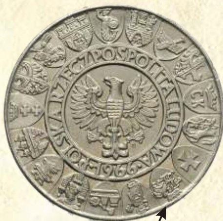
29. Awers i rewers pamiątkowej monety 100 zł wybitej z okazji 1000-lecia Państwa Polskiego, http://forum.tpzn.pl/index.php?action=printpage;topic=139.0 ; images, dostęp dnia 14.05.2012 r.