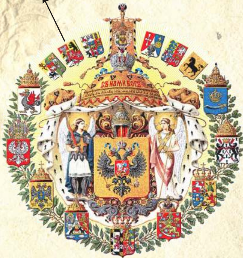
16. Herb Wielki Cesarstwa Rosyjskiego, 1882 r., http://pl.wikipedia.org/wiki/Herb_Rosji dostęp dnia 14.05.2012 r.

Z czasem pojawiła się możliwość odstąpienia od wersji herbu z 1845 r. Car Aleksander III dwoma ukazami w 1882 r. ustalił poczet tytułów cesarskich i opis wielkiego herbu cesarstwa rosyjskiego. Pośród tytułów przysługujących cesarzowi znalazł się tytuł „księcia białostockiego” a na jednej ze zbiorowych tarcz umieszczono herb księstwa białostockiego.