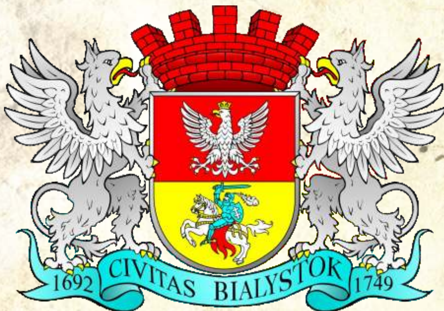
32. Dostojna wersja herbu Białegostoku, 1995- , http://www.bialystok.pl/906-symbolle-miasta/default.aspx dostęp dnia 14.05.2012 r.

Obecny kształt herbu miasta uregulowała uchwała Rady Miasta nr XIII/76/95 z dnia 27 lutego 1995 r. mówiąca, że Herb miasta będzie wyglądał następująco: Tarcza Herbowa dzielona w pas. Część górna czerwona, dolna złota. Na części górnej orzeł srebrny w koronie złotej, ze złotym dziobem i szponami oraz czerwonym językiem. W części dolnej Pogoń Litewska, której koń jest srebrny ze złotą uprzężą i czerwonym trójdzielnym czaprakiem. Jeździec w zbroi niebieskiej, szyszak niebieski z otwartą przyłbicą i srebrnym piórem, miecz wzniesiony niebieski, ostrogi złote. Tarcza jeźdźca niebieska, na niej srebrny krzyż jagielloński. W dostojnej wersji herbu dwa srebrne gryfy trzymają tarczę herbu, a nad nią koronę miejską. Pod tarczą wstęga srebrna z napisem CIVITAS BIALYSTOK