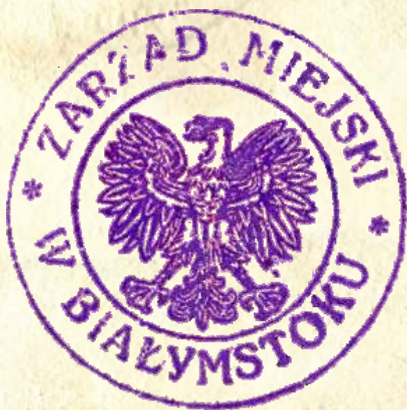
26. Pieczęć urzędowa Zarządu Miasta w Białymstoku, 1946 r., AP w Białymstoku, Zarząd Miejski w Białymstoku, nr zesp. 88, sygn. 161

Po zakończeniu wojny władze miejskie używały nadal herbu z okresu międzywojennego, choć tego nie sformalizowały. Używano też kilku różnych pieczęci.