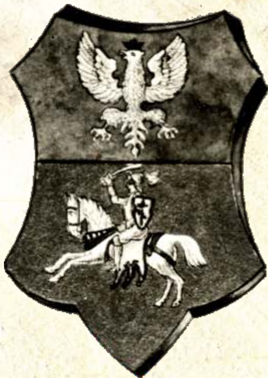
19. Herb Białegostoku, 1919 r., AP w Białymstoku, Akta miasta Białegostoku, nr zesp. 64, sygn. 133

Niekorzystny przebieg Wielkiej Wojny sprawił, że 13 sierpnia 1915 r. Rosjanie opuścili Białystok. Na ich miejscu pojawili się Niemcy, którzy na nowo zdobytych terenach powołali Militar Verwaltung Białystok-Grodno. Nowi okupanci bardzo sprawnie administrowali zajętymi terenami, po kilku dniach miasto otrzymało światło elektryczne i wodę, po dwóch miesiącach działały wszystkie urzędy, wprowadzono nowe przepisy porządkowe i podatki. W tym czasie najprawdopodobniej powrócono do herbu z Orłem i Pogonią. Ich wizerunek pojawił się m.in. na znaczkach pocztowych emitowanych w sierpniu 1916 r. przez Pośrednictwo Pocztowe w Białymstoku.