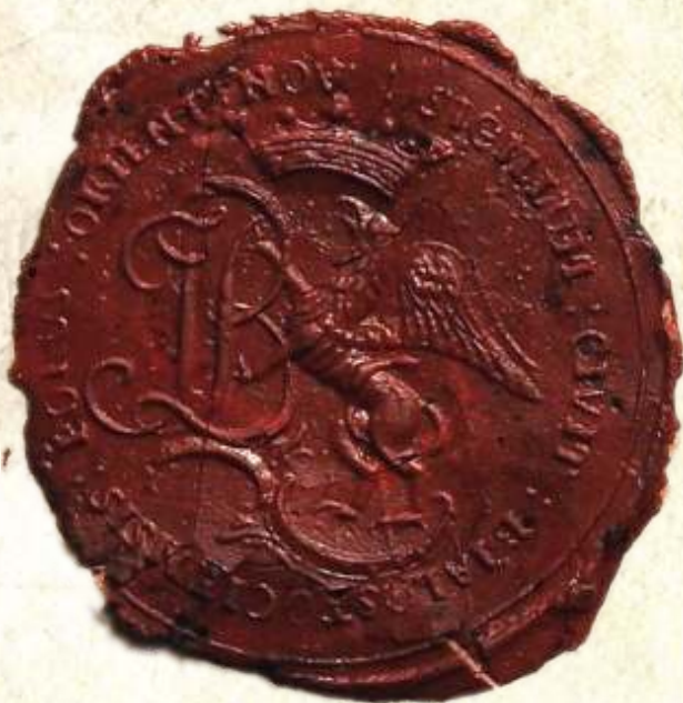
8. SIGILLUM CIVIT BIALOSTOCIENSIS BORUS ORIENT NOV, 1802, AP w Białymstoku, Kamera Wojny i Domen w Białymstoku, nr zesp. 2, sygn. 3104