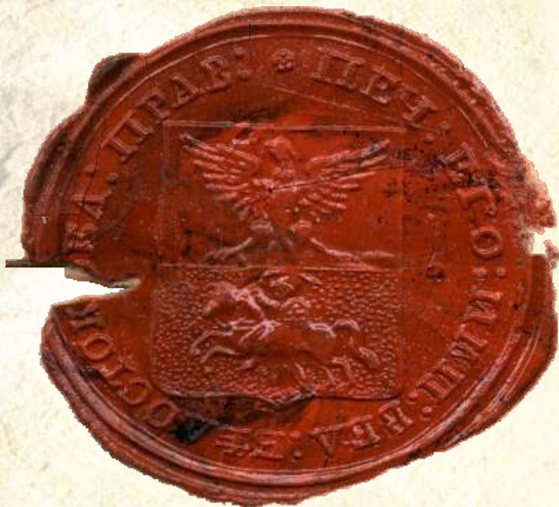
10. Pieczęć miasta Białegostoku, 1835 r., AP w Białymstoku, Sąd Okręgowy w Białymstoku, nr zesp. 277, sygn. 23