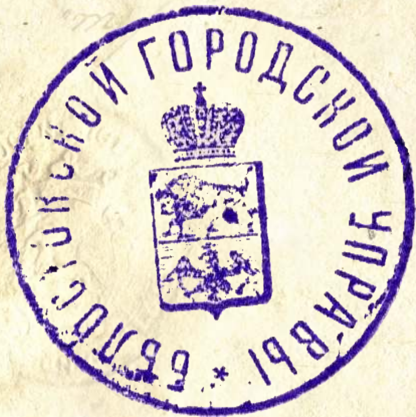
18. Pieczęć Rady Białegostoku, 1914 r., AP w Białymstoku, Akta miasta Białegostoku, nr zesp. 64, sygn. 6

Przeprowadzony przez białostoczian wybieg wyszedł na jaw w czasie inspekcji urzędowej w 1910 r. Gubernator grodzieński pouczył zarząd miasta, że bezprawnie korzysta z herbu Obwodu Białostockiego. Polecił zdjąć go z gmachu i nigdy więcej się nim nie pieczętować a na końcu zalecił powrót do herbu nadanego w 1845 r. Zarząd miasta zastosował się do zaleceń gubernatora i powrócił do herbu powiatowego z żubrem i orłem w koronie.